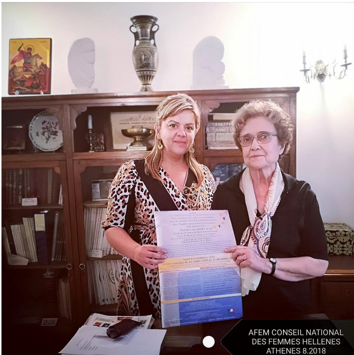
AFEM CONSEIL NATIONAL DES FEMMES HELLENES ATHENES 8.2018