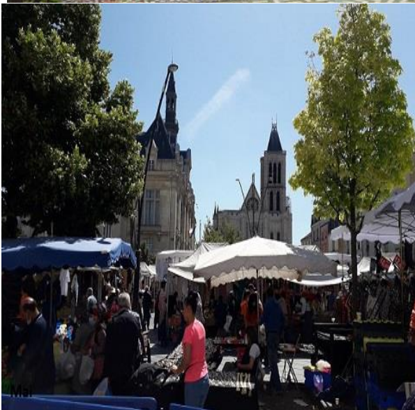
Mairie, Basilique Saint-Denis le jour du marché