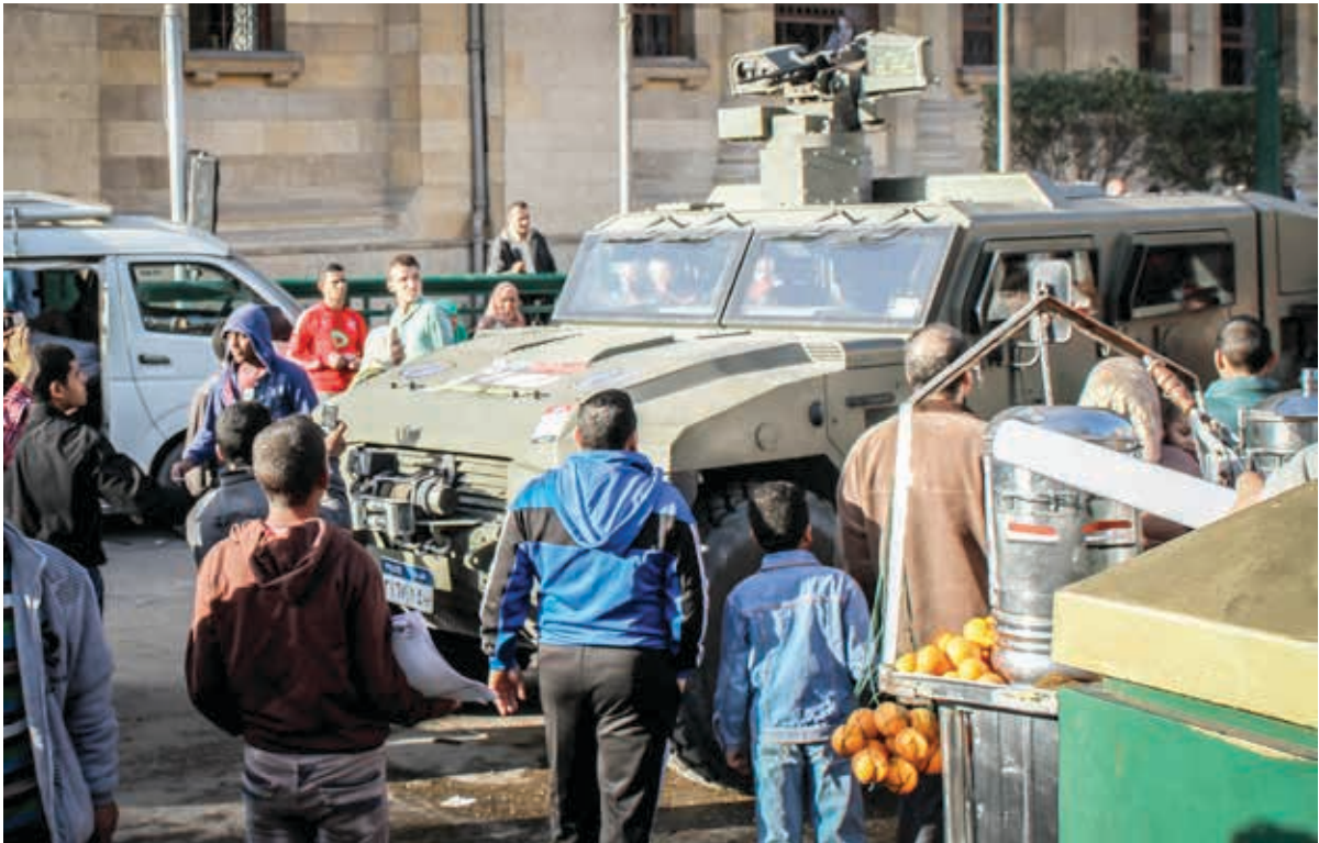
Sherpa Scout photographié le 24 Janvier 2014 au Caire.

Malgré la présence attestée de Sherpas Renault Trucks Défense (RTD) sur les sites du massacre de Rabaa et à l'occasion de la répression meurtrière des manifestations du 24-25 janvier 2014 au Caire, les autorités françaises ont continué à autoriser la livraison de véhicules blindés RTD à l'Égypte, lesquels ont de nouvelles fois été utilisés par les forces de sécurité égyptiennes dans la répression de manifestations. Lors des manifestations contre le transfert par les autorités égyptiennes des îles Tyran et Sanafir à l'Arabie Saoudite, le 15 avril 2016, des Sherpa MIDS ont été déployés au centre-ville du Caire comme le montre la photo ci-dessous.