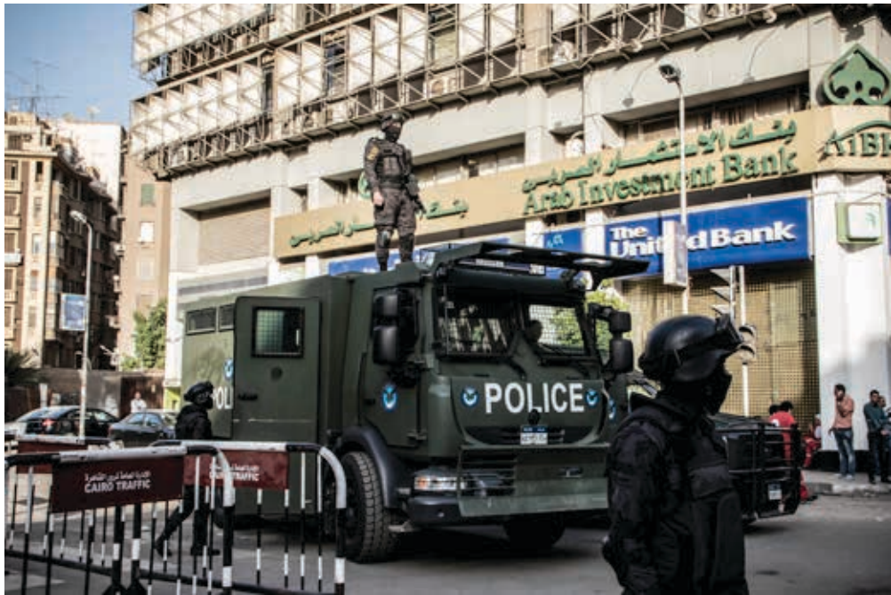
Sherpa MIDS, photographié au Caire 15 Avril 2016 près du Syndicat des journalistes.