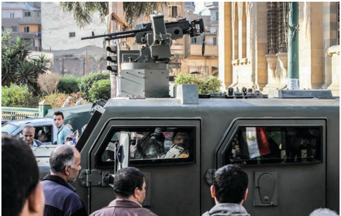
Sherpa MIDS, photographié au Caire 15 Avril 2016 jour de mobilisation importante contre les autorités, à l'occasion du transfert par le gouvernement égyptien des îles Tyran et Sanafir à l'Arabie Saoudite 166 .

Malgré la présence attestée de Sherpas Renault Trucks Défense (RTD) sur les sites du massacre de Rabaa et à l'occasion de la répression meurtrière des manifestations du 24-25 janvier 2014 au Caire, les autorités françaises ont continué à autoriser la livraison de véhicules blindés RTD à l'Égypte, lesquels ont de nouvelles fois été utilisés par les forces de sécurité égyptiennes dans la répression de manifestations. Lors des manifestations contre le transfert par les autorités égyptiennes des îles Tyran et Sanafir à l'Arabie Saoudite, le 15 avril 2016, des Sherpa MIDS ont été déployés au centre-ville du Caire comme le montre la photo ci-dessous.