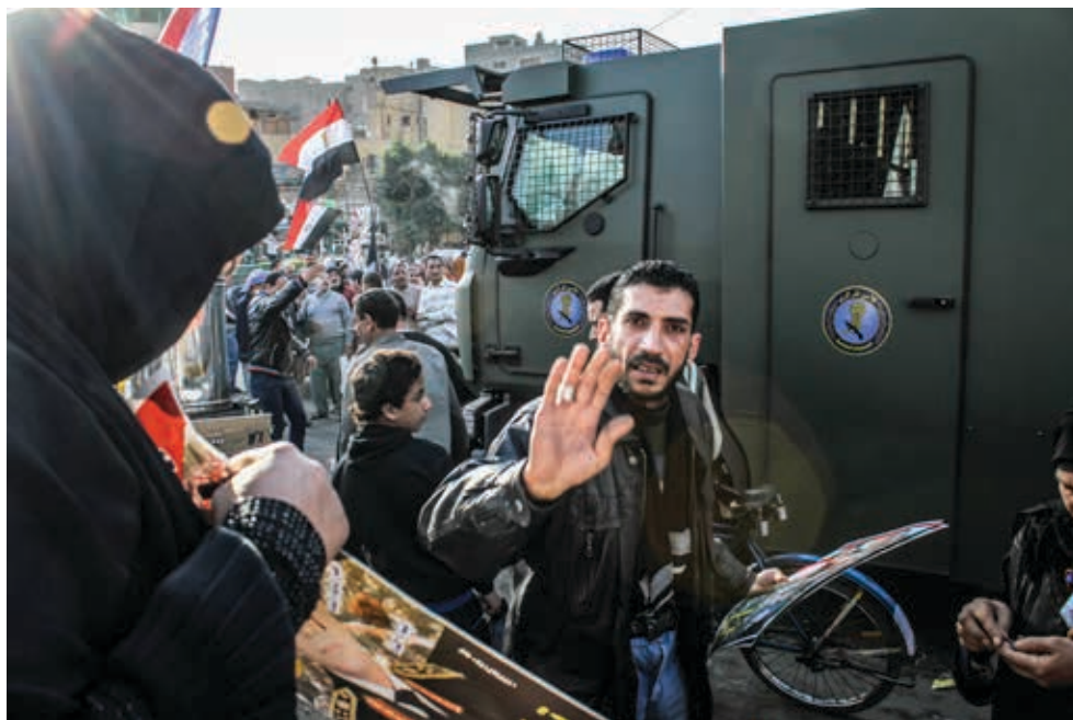
Sherpa MIDS photographié au Caire les 24&25 janvier 2014.

Pourtant, certaines informations indiquent que les Sherpas ont également été utilisés pour répondre de manière violente à certaines manifestations organisées entre 2013 et 2015. Un cas documenté d'utilisation des véhicules Sherpas dans la répression violente d'une manifestation concerne les événements du 14 août 2013, lorsque les forces de police ont violemment dispersé les sit-ins de Rabaa Al Adawiya et de Al Nahda. Bien que des témoignages fassent état de quelques personnes armées parmi les nombreux manifestants, le ministère de l'intérieur a pris la décision illégale d'utiliser une force maximale pour disperser les manifestants. Les forces de police ont eu recours à des tirs qui ont entraîné la mort de près de 1000 personnes 160 . Les moyens tactiques mis en œuvre par les forces de police étaient non discriminés et disproportionnés par rapport aux menaces de violence ou aux activités des manifestants. A cette occasion, divers enregistrements vidéo et des photos montrent que des véhicules Sherpa ont été déployés sur la place Rabaa aux côtés d'autres véhicules de police et engins blindés. D'autres vidéos montrent ce qui ressemble fortement à un véhicule Sherpa au milieu des manifestants avant que celui-ci ne soit jeté du haut d'un pont menant à la grand-rue sur laquelle se tenait la manifestation 161 .