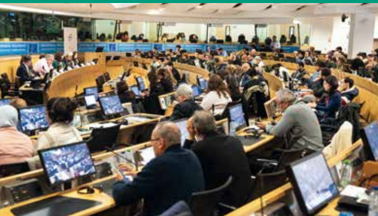
Forum Civil de Bruxelles (programme MAJALAT), décembre 2019.