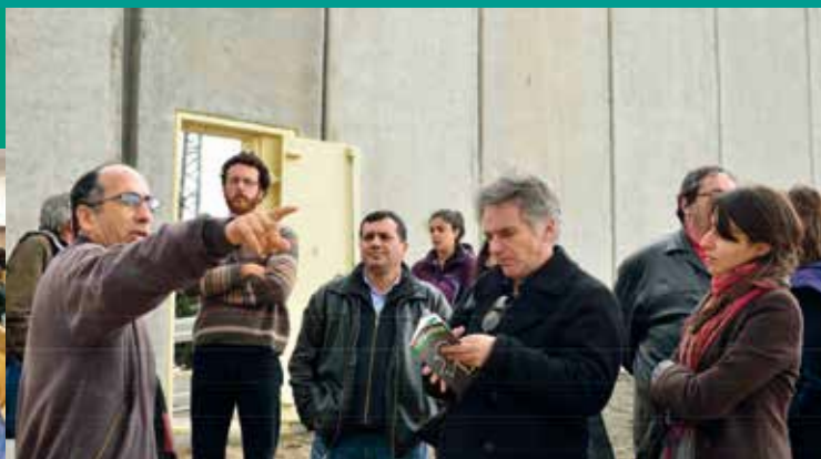
Mission du REF en Palestine, Bethléem, février 2014.

Porter des projets de soutien à la société civile des deux rives en s'appuyant sur l'expérience de nos membres.