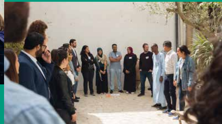
Rencontre du Réseau « Jeunesses méditerranéennes », Tunis, avril 2019

Campagnes d'interpellation, publications à travers Les Cahiers du REF et débats publics autour des grands enjeux méditerranéens actuels.